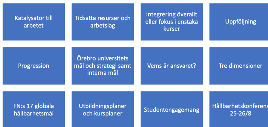
Figur 3, Sammanställning av övriga ämnen