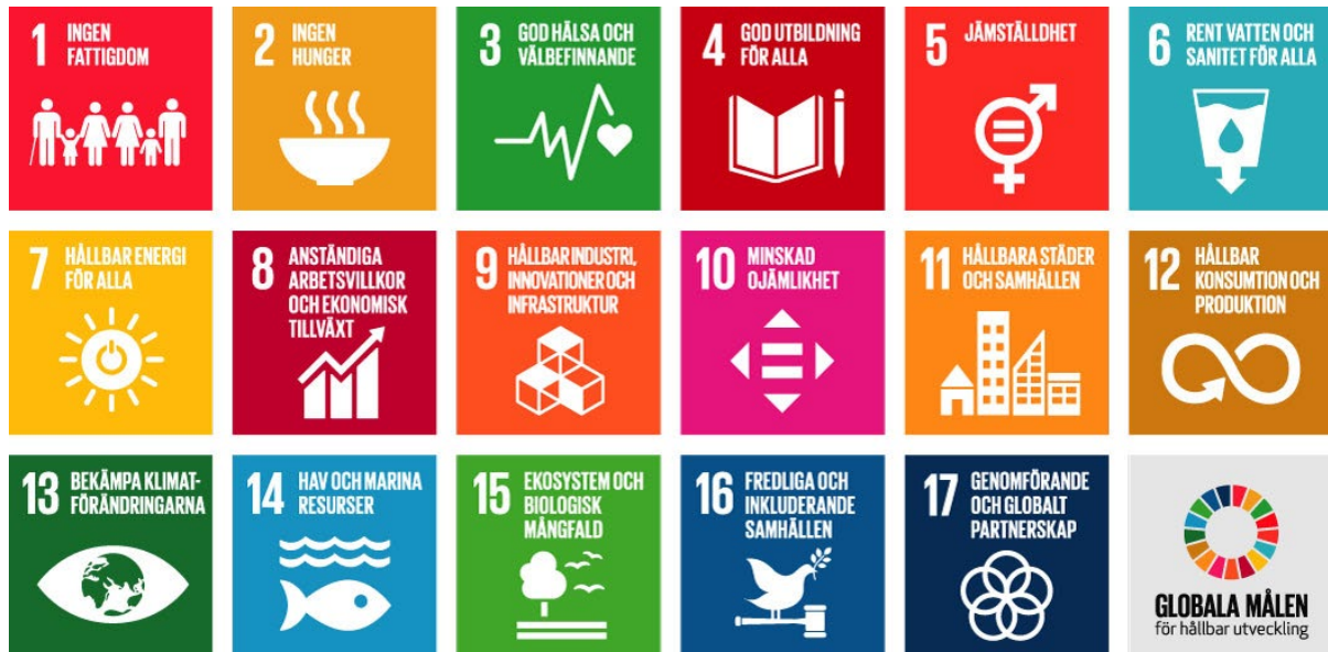
Figur 1, Globala hållbarhetsmål ( https://www.globalamalen.se/ )

figur 1). Den sociala dimensionen fokuserar människors sociala relationer, trygghet och jämlikhet (Lindahl, 2020).